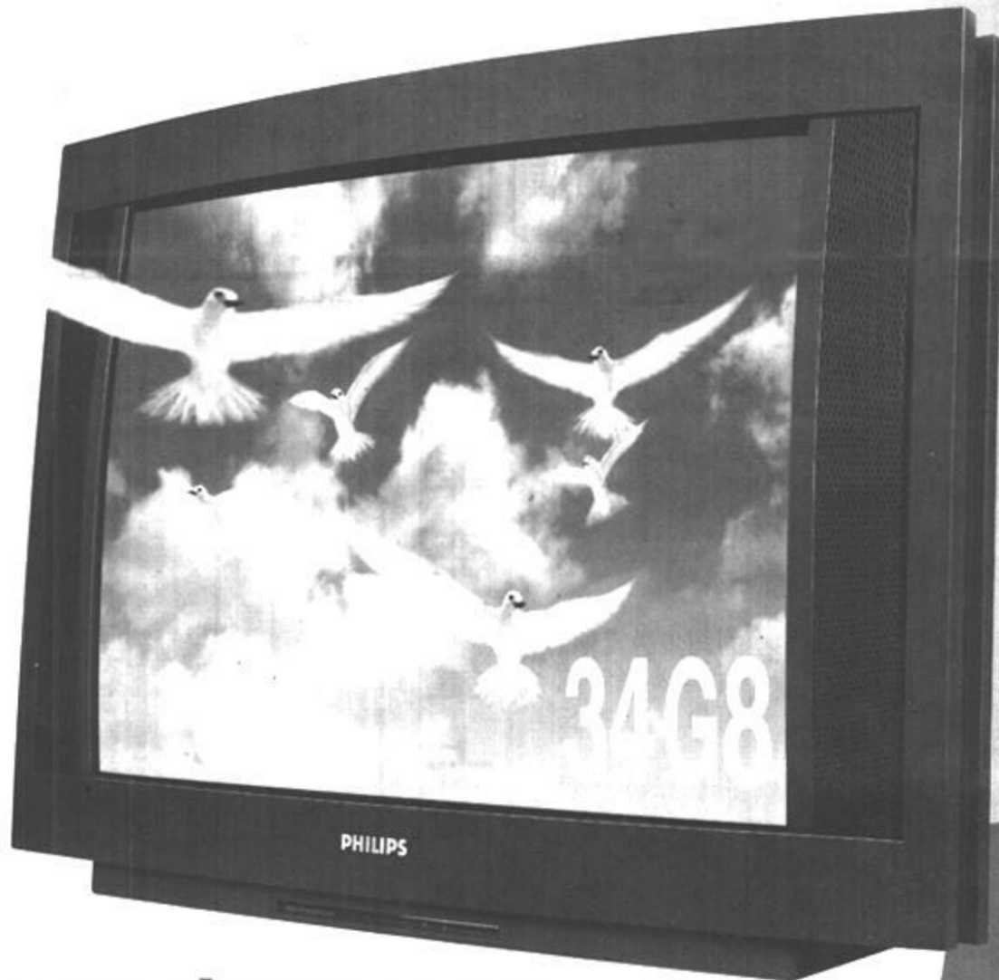
飞利浦 超奇形 彩色电视 型号：34G8