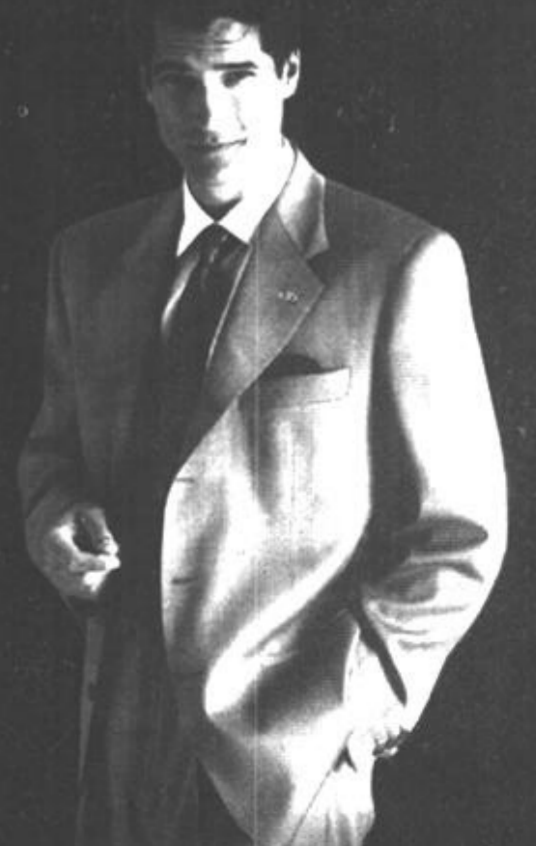
雅戈尔特型模特——007扮演者